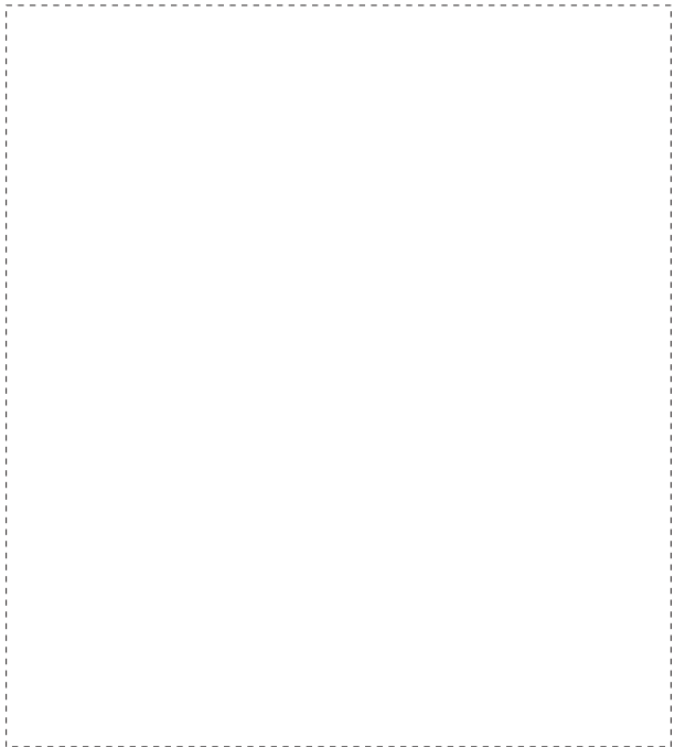
croquis de localisation des tuiles constituant le Fait